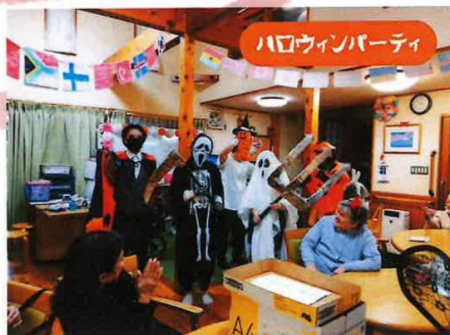
ハロウィンパーティ

昨年9月に念願の訪問事業所を開設する事が出来ました。開始までの道のりは決して易しくはありませんでしたが、無事に現在に至りますのもひとえに皆様の温かい励ましやご支援のおかげだと心より感謝しております。 スタートから数か月。分らない事も多く、時には失敗をしながらも新しい出会いや出来事にわくわくする毎を送り、周囲に支えられている事をより一層実感し、「頑張らなければ！」の思いを強くしております。