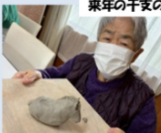
来年の干支の置物作り