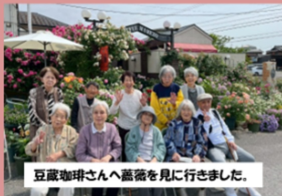
豆蔵珈琲さんへ薔薇を見に行きました。