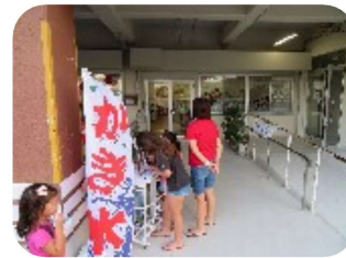
利用者さんが来てくれました