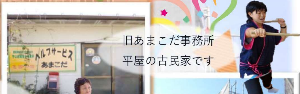
旧あまこだ事務所 平屋の古民家です