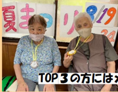
TOP3の方にはメダルが!