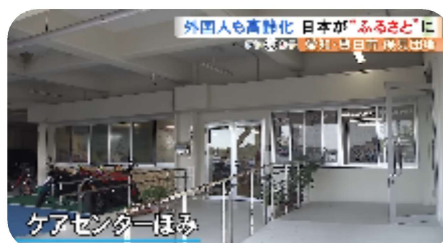
ケアセンターほみ