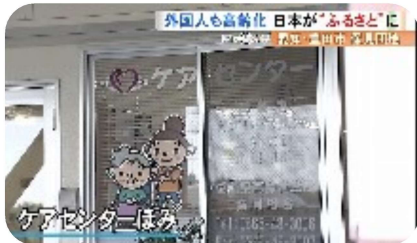
ケアセンターほみ