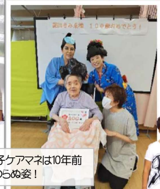
長江新子ケアマネは10年前から変わらぬ姿！